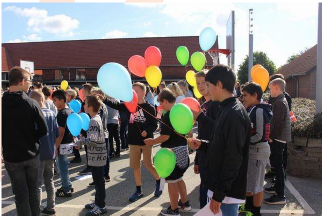
Skolestart Bavnehøj Skole 2018